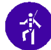
Protezione individuale obbligatoria contro le cadute dall'alto