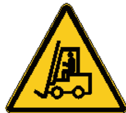
Carrelli di movimentazione