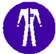
Protezione obbligatoria del corpo