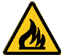
Materiale infiammabile o alta temperatura