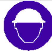
Casco di protezione obbligatorio