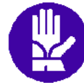
Guanti di protezione obbligatori