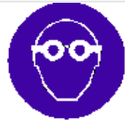
Protezione obbligatoria degli occhi