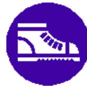
Calzature di sicurezza obbligatorie