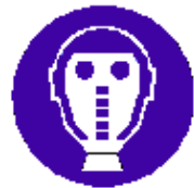
Protezione obbligatoria delle vie respiratorie