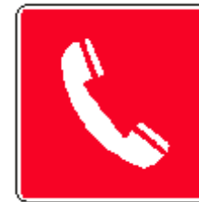
Telefono per interventi antincendio