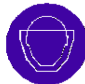
Protezione obbligatoria del viso