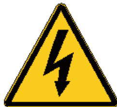
Tensione elettrica pericolosa